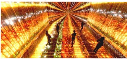
Refik Anadol'un Pilevneli Dolapdere'deki sergisi büyük ilgi görüyor.

Sergiyi görmek için strada bekleyenlerin fotoğraflarını çekip "Tüp sırası gibi" demelerine, küçümsemelerine dayanamadım. Benim sorumluluğum olmalı orada. O üsluba bir cevabım olmalı. Bu küçümsemeyi görmezden gelmek büyük bir utanç kaynağı. Ama öyle bir algi oluşturuldu ki, sanki ben hakkımda yazılanlar çekemediğim iş yazmışım. Hayır, hiçbir yazıya ya da eleştiriyeye